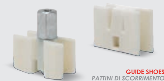
GUIDE SHOES PATTINI DI SCORRIMENTO