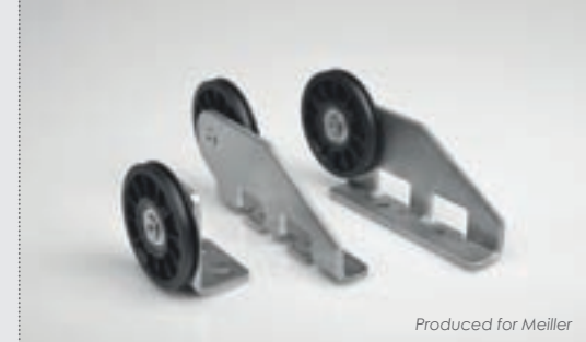
Produced for Meiller